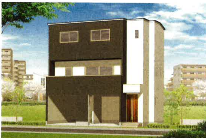
※イメージパースです